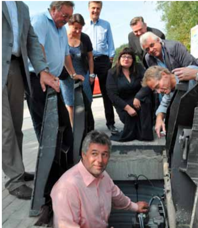
Eröffnung und Einweisung in die Technik des Hochwasserschutzes

Heiligenhafen – Einen weiteren großen Schritt nach vorne hat die Stadt Heiligenhafen bei ihrem Riesenprojekt Hochwasserschutz gemacht. Nachdem der Steinwarder ein Jahr zuvor quasi höhergelegt worden war, ist nun auch der Ferienpark mittels eines Schutzwalls vor Sturmfluten und Hochwasser bis zu einer Höhe von 2,60 Meter üNN gesichert worden. Gekostet hat das die Stadt rund 500.000 Euro, die Eigentümer der Apartments im Ferienpark haben sich mit jeweils rund 280 Euro an den Baukosten beteiligt.